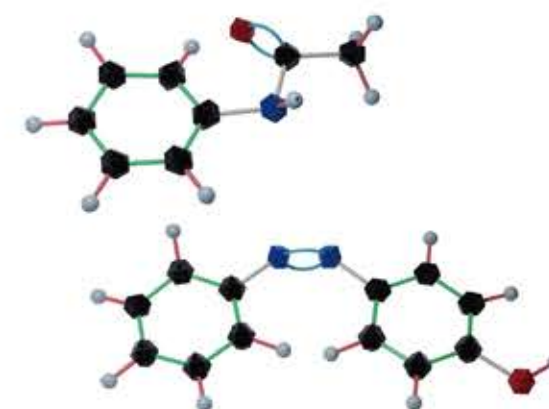
【本セットで作成できる構造模型例】

国内外の多くの大学で指定採用品として実績を積み上げてきた商品です。理工系の学部だけでなく、薬学部などでも採用いただいています。有機化学のテキストを読む傍らで、取り上げられた化合物を組み立てることにより、より高い学習効果を得ることができます。