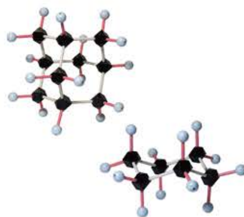
【本セットで作成できる構造模型例】

本セットはパーツが非常に少ないために複数の化合物を同時に作成して比較するという用法には向いておりません。