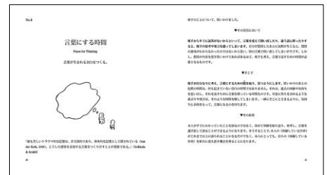
※内容イメージ(既刊)