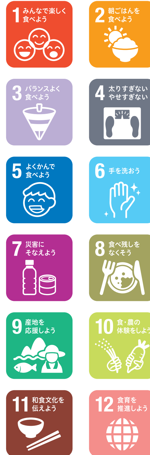
農林水産省「食育ピクトグラム」

※ご注文をいただいた個人情報は、書店、取次(流通)・弊社間での商品手配の目的に利用させていただきます。